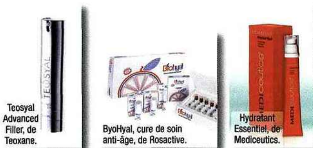
Teosyal Advanced Filler, de Teoxane.

Très souvent et en particulier pour le visage, on a recours à la technique des multiponctures. Cela consiste en fait, à injecter des micro-gouttes de produits, de manière très rapprochée, partout sur la zone à traiter. « Ce qu'il y a de très intéressant